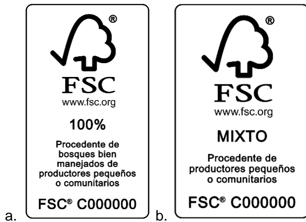
Figura 2. Etiquetas FSC con la propuesta para el nuevo texto de etiqueta para: a. 100% FSC y FSC Mixto.

El uso de la etiqueta debe cumplir el Estándar FSC Internacional FSC-STD-50-001 (V1-2) sobre los Requisitos para el uso de las marcas registradas FSC por parte de los Titulares de Certificados.